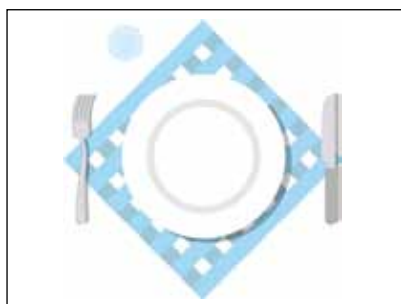
Réitigh an bord roimh bhéile