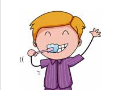
Múch an t-uisce a fhad is a bhíonn na fiacla á nglanadh agat