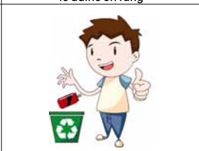
Ardaigh píosa bruscair