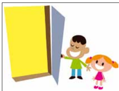
Lig do dhuine ón rang dul romhat sa scuaine

Déan an íomhá a fhilleadh agus a chur i 'cupán an chineáltais'. (Bain úsáid as cupán/babhla/próca). Tabhair cuireadh do gach páiste píosa páipéir a phiocadh amach agus a choimeád go dtí go roinntear an cineáltas. Is féidir a leithéid a dhéanamh cúpla uair i rith na seachtaine. Coimeád 'cupán an chineáltais' san Áit Urnaí i rith na seachtaine.