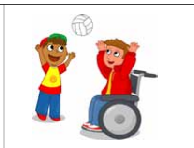
Roinn le cara leat