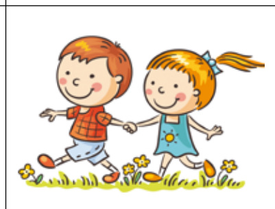
Tabhair cuireadh do dhuine nua a bheith ag súgradh leat