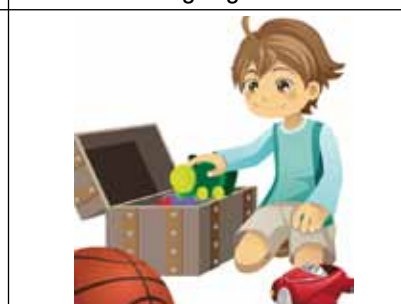
Slachtaigh na bréagáin sula n-iarrtar ort é

Tabhair an dán 'Cupán an Chineáltais' (FIG, NB, Téama 1: Mo Theaghlach) chun cuimhne.